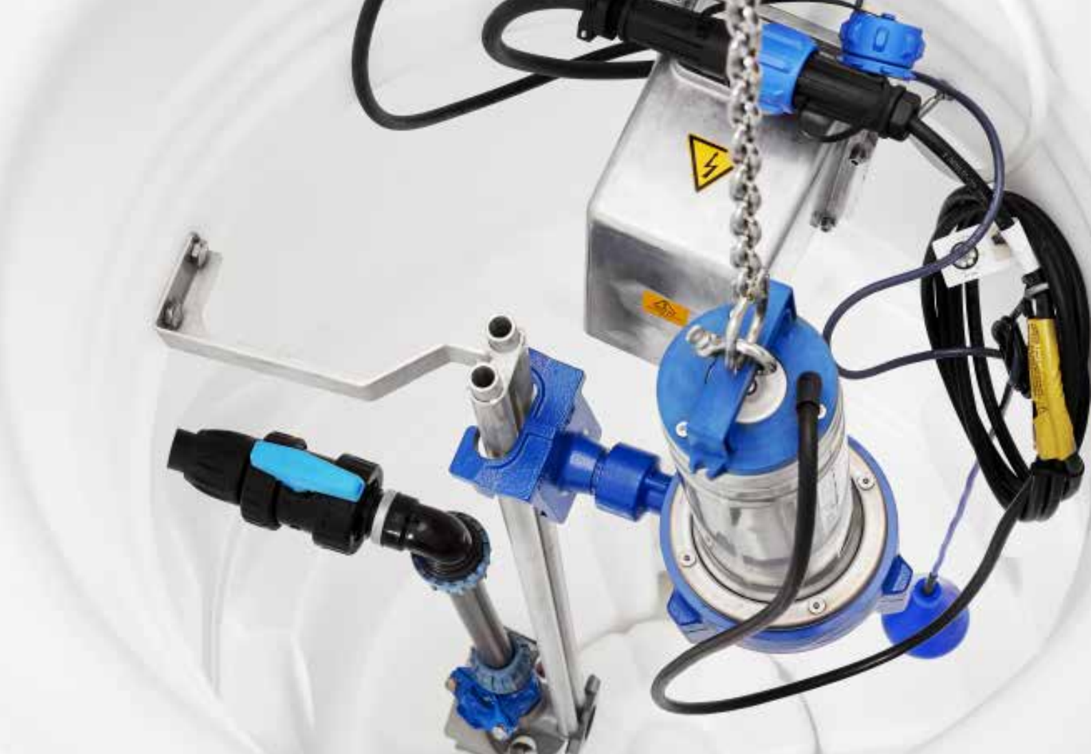
Compit 901 med pumpar i hängande montage, H alternativt med gejdör och bottenmonterad kopplingsfot s k P-montage